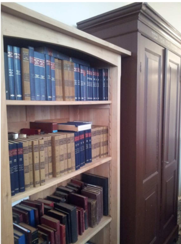
NIK gebedenboeken in sjoel te Winterswijk